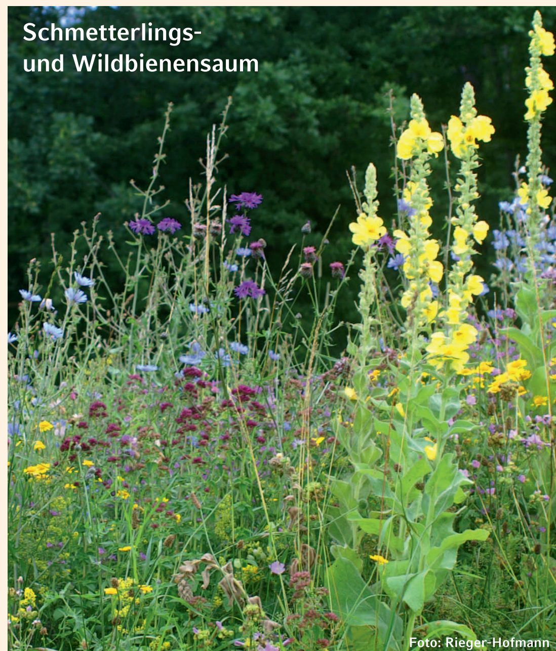
Schmetterlings- und Wildbienen-saum